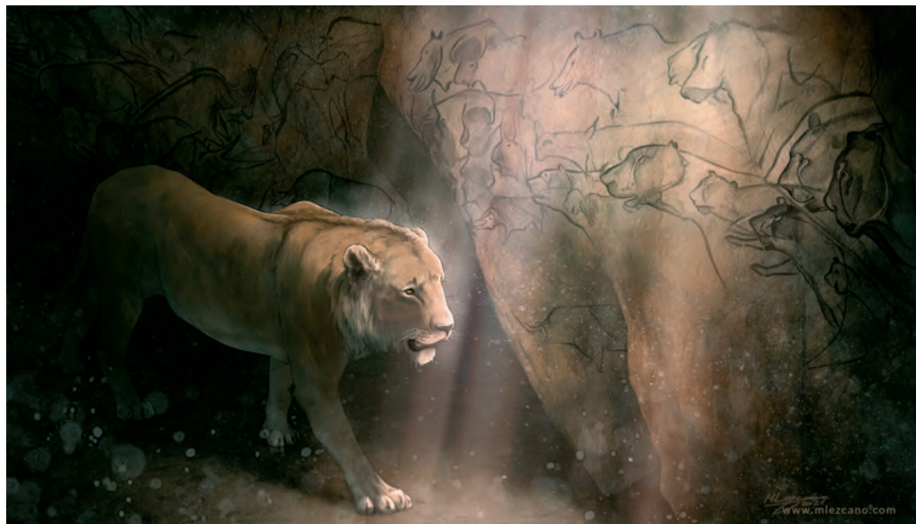
Jeskynní lev.

acknowledged their connection to the animal world through art even in those prehistoric times when the first pieces symbolic of their culture were created. It is probably no coincidence that the objects of their artistic interest were not landscape or flora. The focal point of their reflection on the world was fauna. Perhaps they were aware, even then, that animals such as lions, which they admired for their predatory and fierce strength, were integral and desirable features of nature. In fact, in the Upper Palaeolithic, people gradually transformed into fierce predators who ruthlessly began to claw their way to the very top of the food chain. Archaeological findings show that the spread of anatomically modern humans was linked to the extinction of megafauna in the world. Humans have always longed to be successful, strong and powerful. They longed to be like the lion. This symbolism has successfully persisted from prehistoric times, through ancient and medieval times,