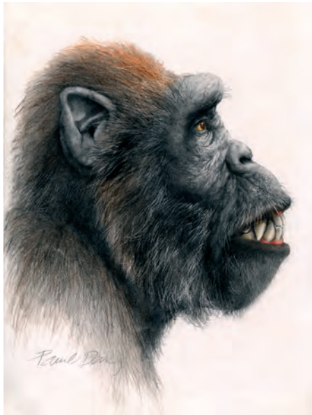
Pavel Dvorský, Člověk , kresba Gigantopithecus blacki . © Pavel Dvorský.

Pavel Dvorský, The Human , drawing of Gigantopithecus blacki . © Pavel Dvorský.