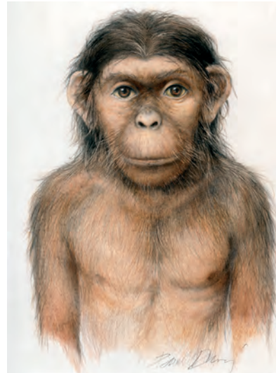
Pavel Dvorský, Člověk , kresba Australopithecus africanus . © Pavel Dvorský.

Pavel Dvorský, The Human , drawing of Australopithecus aethiopicus . © Pavel Dvorský.