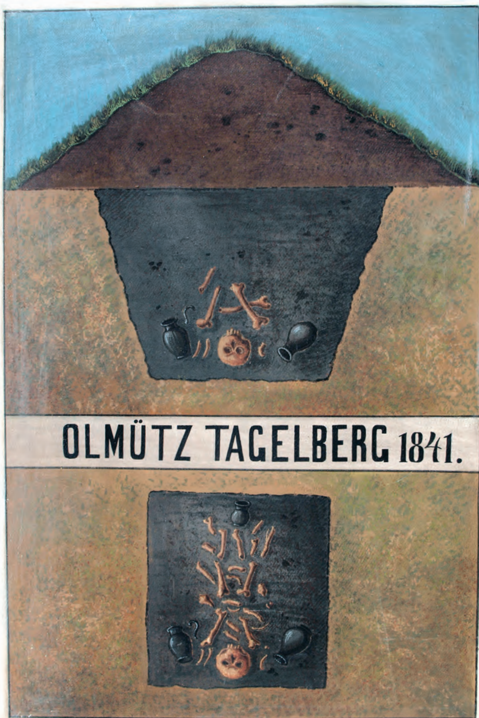
Akvarel dokumentující nález z Olomouce – Nové ulice z roku 1841.

A watercolour documenting a find from Olomouc – Nová Street from 1841.