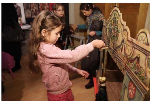
RODINNÁ LOUTKOVÁ DIVADĚLKA - SKROMNÉ STÁNKY MÚZ

Od 30. listopadu 2010 do 31. května 2011