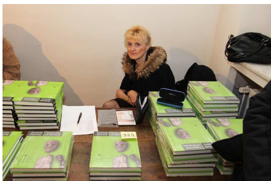
Křest knihy Poklady Moravy