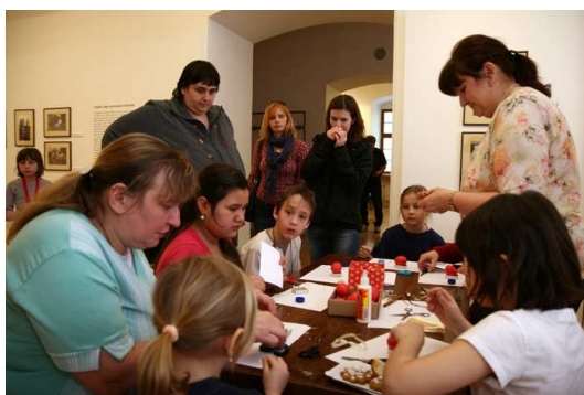
Velká velikonoční dílna