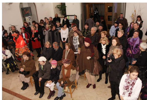
BÁLY, PLESY, MASOPUSTY....

Od 30. listopadu 2010 do 31. května 2011