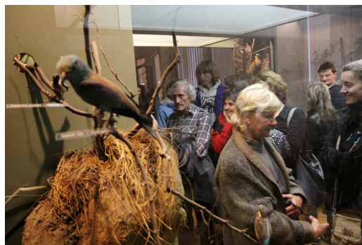
Brněnská muzejní noc: 15. 5. 2010