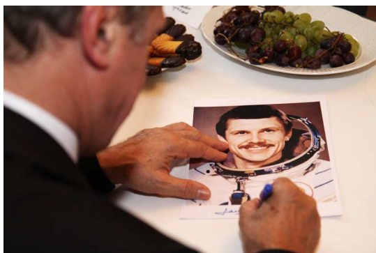
Slet středoevropských kosmonautů/Meeting of CENTRAL EUROPEAN ASTRONAUT – 15. 9. 2010