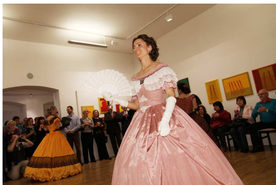
Dýchánek u šlechtíčen, aneb co v Brně ještě nebylo... - pátek 3. 12. 2011