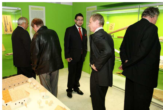
POKLADY MORAVY – PŘÍBĚH JEDNÉ HISTORICKÉ ZEMĚ