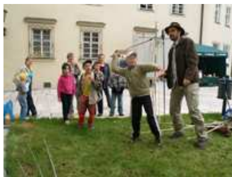
Vezmi tátu do muzea - sobota 19. 6. 2010