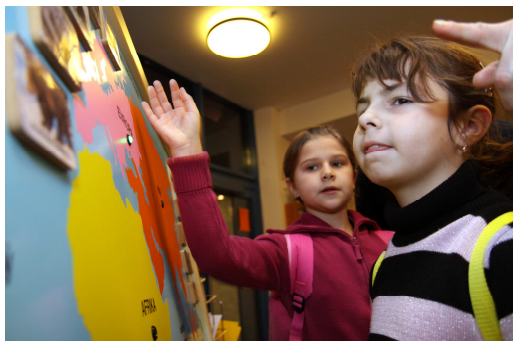
Derniéra výstavy Darwin a slavnostní zakončení akce Motýl pro pana Darwina.

14. 3. 2010 15 – 18 hodin, Pavilon Anthropos