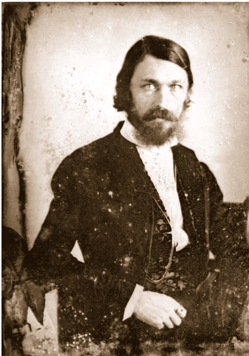
První známý portrét mladého a charismatického Josefa Miloslava Hurbana. Dagerotypie byla pořizena v březnu 1849 v ateliéru bratří Angerovců ve Vídni. Převzato z publikace Jozef Miloslav Hurban – prvý predseda Slovenskej národnej rady. Bratislava 2007.