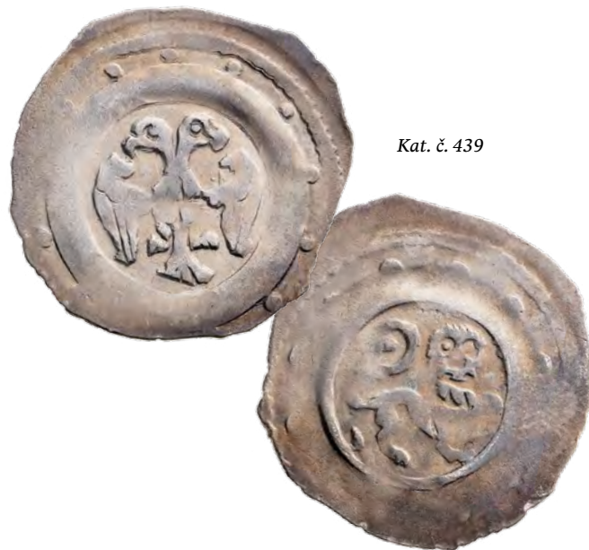
Kat. č. 439