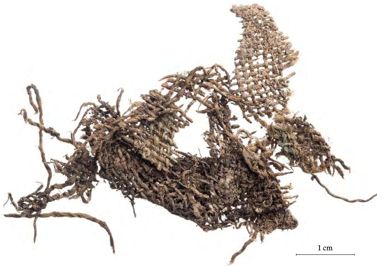
Obr. 2. Zbytky tkaniny, do které byly mince a šperky ze střelického pokladu zabaleny

Uloženo: Moravské zemské muzeum, inv. č. 4901