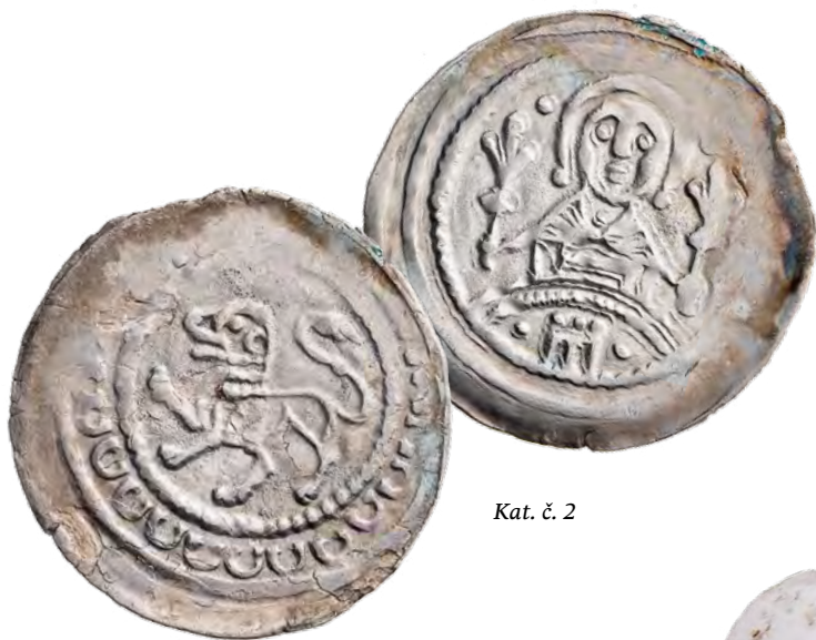
Kat. č. 2