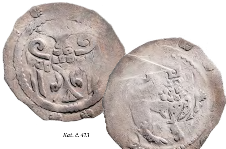
Kat. č. 413