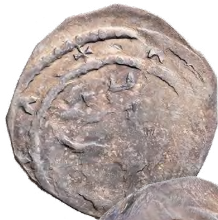
Kat. č. 424