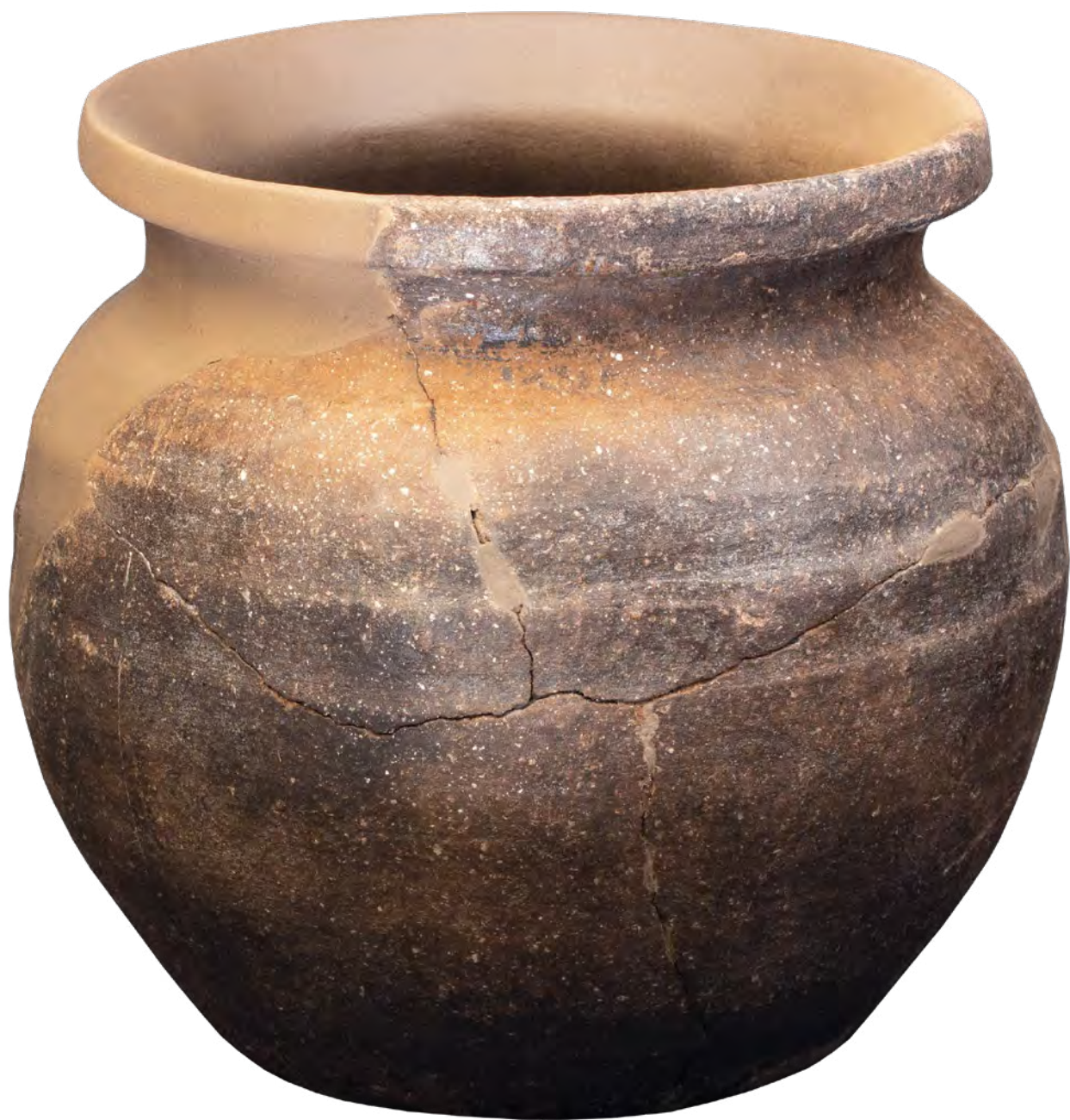
Obr. 4. Nádoba pokladu ze Střelic po rekonstrukci a doplnění