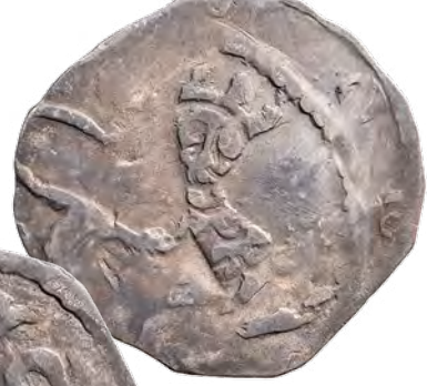
Kat. č. 430