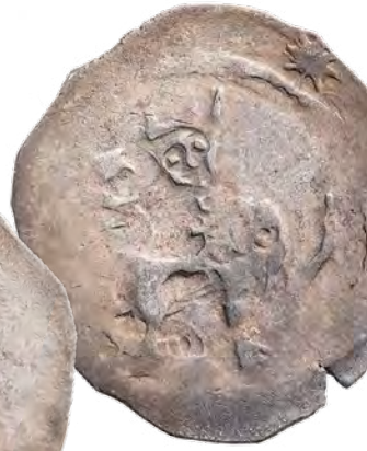
Kat. č. 422