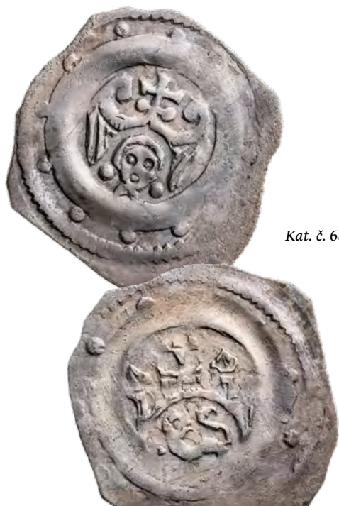
Kat. č. 686

Poklad ze Střelice obsahuje celkem 1 352 mincí. Dochovaná mincovní složka nálezů je svým složením velmi neobvyklá. Tvořena je třemi hlavními částmi, jedná se o složku denárovou, fenikovou a brakteátovou. Denárová složka je tvořena výhradně domácí moravskou mincí, feniky pocházejí v převážné většině z rakouských zemí, velká většina brakteátů byla přiřazena do Míšeňského markrabství. Složka obsahuje také dosud nepřirazené ražby žádnému vydavateli, podle fabriky mincí však předpokládáme jejich původ v jihoněmecké a středoněmecké oblasti.