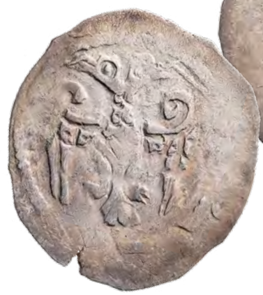
Kat. č. 426