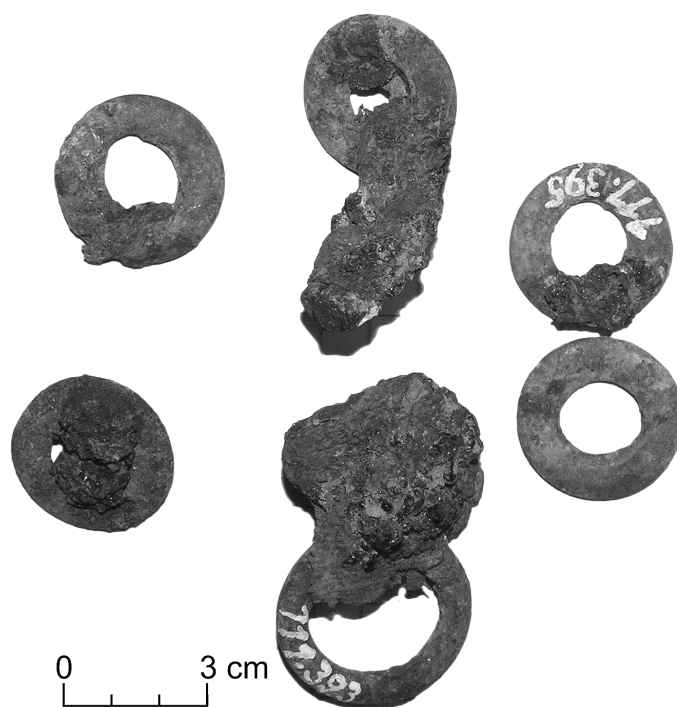
Obr. 1. Marefý, U lišek, hrob 14, inv. č. 111.392-397 (Pa 31/35-192). Jemná tkanina, ktorá sa nachádza na jednej strane bronzových krúžkov umiestnených v oblasti hrudníka, pochádza pravdepodobne z odevu zomrelého.