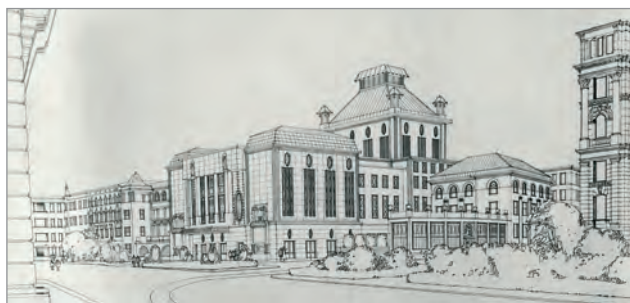
Obr. 49./ Fig. 49. Architekt Emil Králík (zakoupeno)/ Architect Emil Králík (purchased).