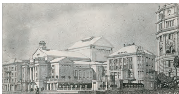
Obr. 46./ Fig. 46. Anonymus (zakoupeno)/ Anonymous (purchased).