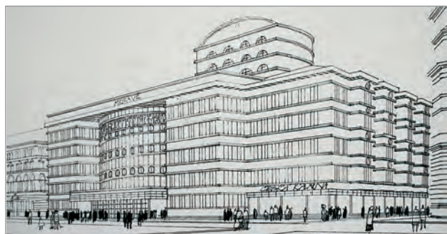
Obr. 50./ Fig. 50. Architekt Pavel Janák/ Architect Pavel Janák.