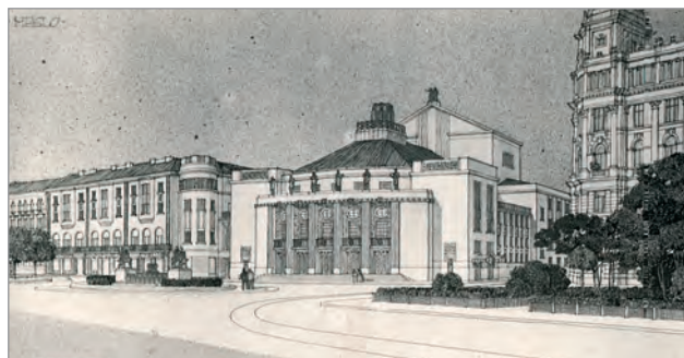
Obr. 44./ Fig. 44 Architekt Alois Dryák (2. cena)/ Architect Alois Dryák (2nd prize).