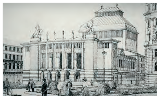
Obr. 48./ Fig. 48. Architekt František Roith (zakoupeno)/ Architect František Roith (purchased).