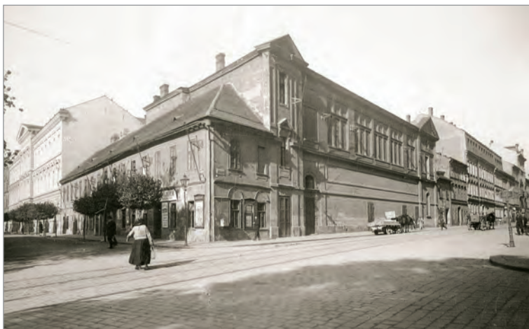
Obr. 14./ Fig. 14. Divadlo na Veverří ulici./ The theatre on Veverří ulice.

Slavnostní otevření stále české profesionální divadelní scény v Brně v přestavěném tanečním sále budovy hostince U Marovských na rohu Ratvitova náměstí (též Radwitplatz, dnešní Žerotínovo náměstí) a Veverří ulice mělo pochopitelně patřit „národní zpěvohře“ Bedřicha Smetany Prodaná nevěsta . Představení plánované na 29. listopadu 1884 se však neuskutečnilo. Den po schválení nově upraveného sálu stavební komisí totiž vypukl 26. listopadu v divadle požár, který částečně poškodil i hlediště. Ačkoliv byl díky rychlému zásahu brněnských hasičů včas uhašen, muselo se kvůli opravám slavnostní otevření odložit. Zahájení se posunulo na 6. prosince 1884, avšak úvodní představení bylo změněno z Prodané nevěsty na Magelona , tragédii Josefa Jiřího Kolára. První divadelní cedule ještě nesla název české Národní divadlo. Jistě ne náhodou 13. prosince téhož roku vyšlo první číslo Janáčkovy redigovaných Hudebních listů s podtitulem „Časopis věnovaný hudbě a umění divadelnímu“. Z Janáčkovy provolání uveřejněného na první straně časopisu je zřejmé, že primárním posláním nového periodika bylo informovat především o brněnském divadelním dění: