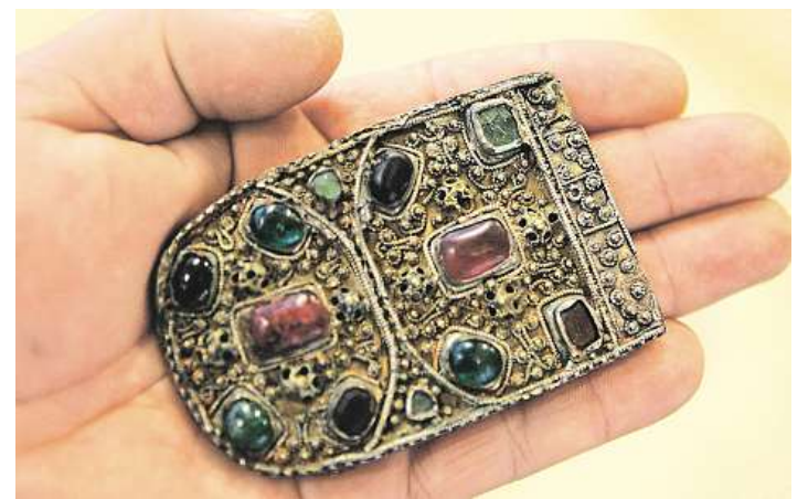
Zlatá spona Díky Hrubému lze prostřednictvím vykopávek či artefaktů poznat dávný život a obdivovat umění starých Slovanů.

lo centrum Velké Moravy? Hrubého objevy odkazovaly na Staré Město, Poulik zastupoval Mikulčice a František Kalousek kopal na Břeclavsku. „Říkalo se, že to jsou tři znesváření Svatoplukovi synové,“ směje se Galuška.